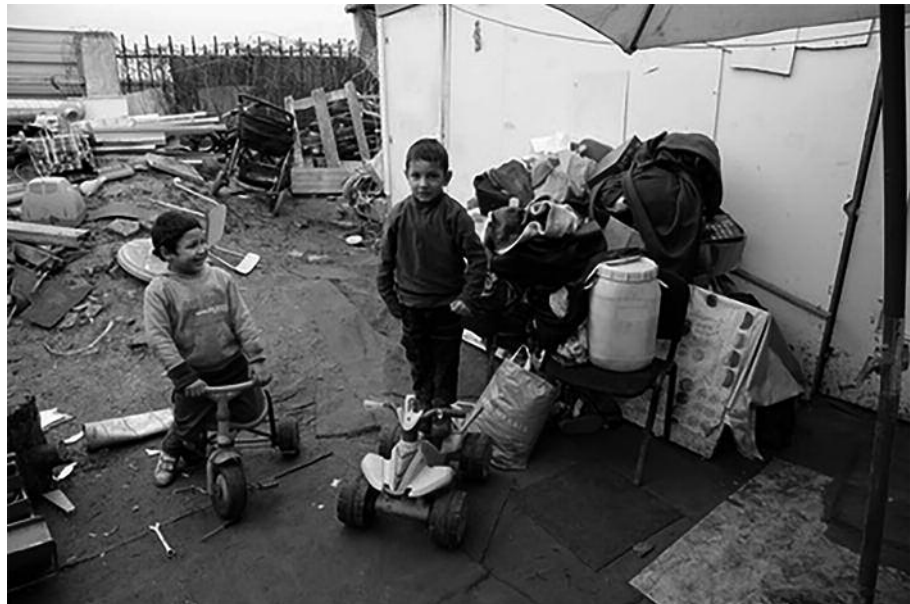
Le camp de Villeneuve-Saint-Georges, en banlieue parisienne

La mairie de Bobigny, qui détient le terrain sur lequel les Roms se sont installés, a fait appel de